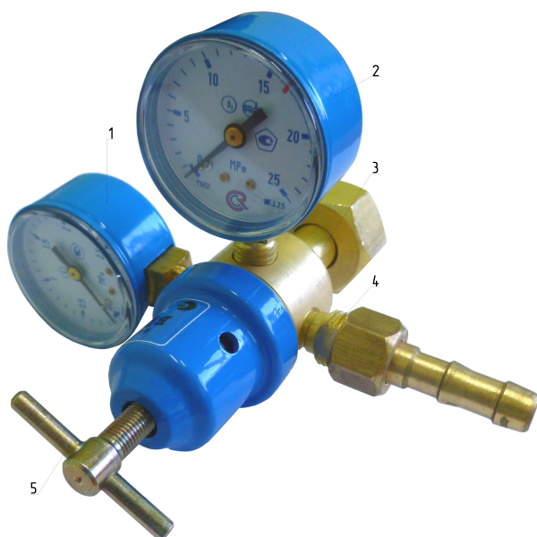
а) ДЖЕТ.156.00.00.00, -02, -05, -09

4.1 Внешний вид редуктора показан на рис.1, 2