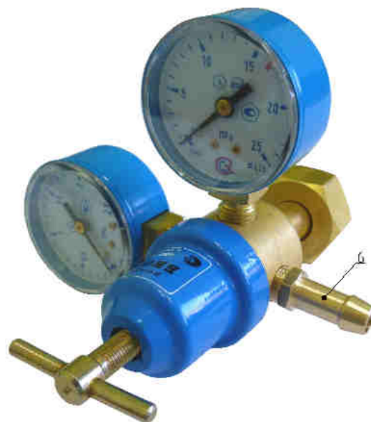
б) ДЖЕТ.156.00.00.00-03, -07